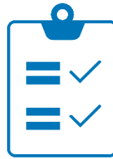
Online - Formulare

Aus diesen Bausteinen werden Veranstaltungen, Infoseiten und Berichte sinnvoll miteinander kombiniert. Ausgangspunkt ist die entsprechende Veranstaltung. In dieser werden alle Informationen, Bilder, Texte erfasst. Von einer Infoseite oder von einem Bericht kann darauf verwiesen werden. Das Ziel muss sein, dass alle Angaben/Informationen nur einmal erfasst werden.